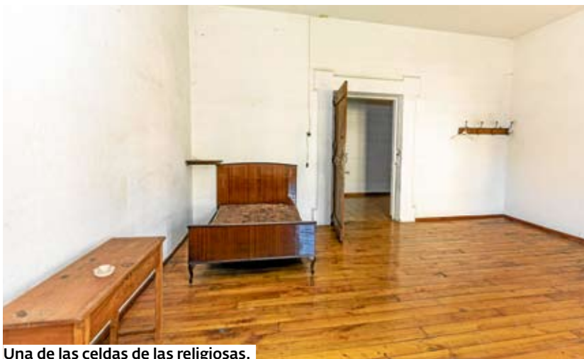
Una de las celdas de las religiosas.