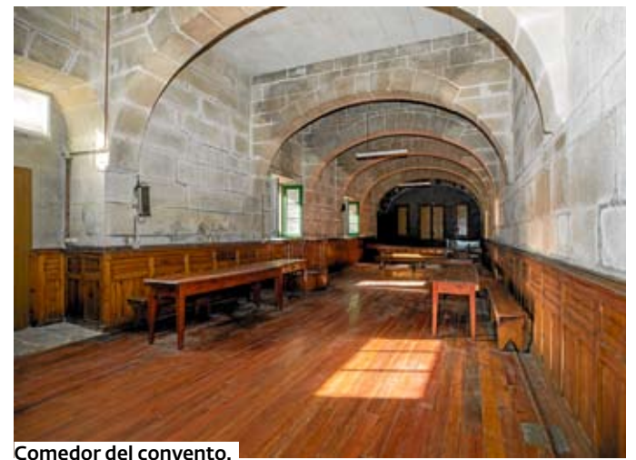
Comedor del convento.

La visita al coro alto encara el final del recorrido guiado. La estancia, donde las monjas rezaban cada mañana y desde donde podían seguir la misa, en la iglesia está presidida por un órgano, «hoxe automatizado, pero que antigamente funcionaba grazas a un gran fol que manexaban dúas relixiosas». Una última parada en la iglesia deteniéndose en sus detalles finaliza la visita. Santa Clara vuelve a quedar desocupada.