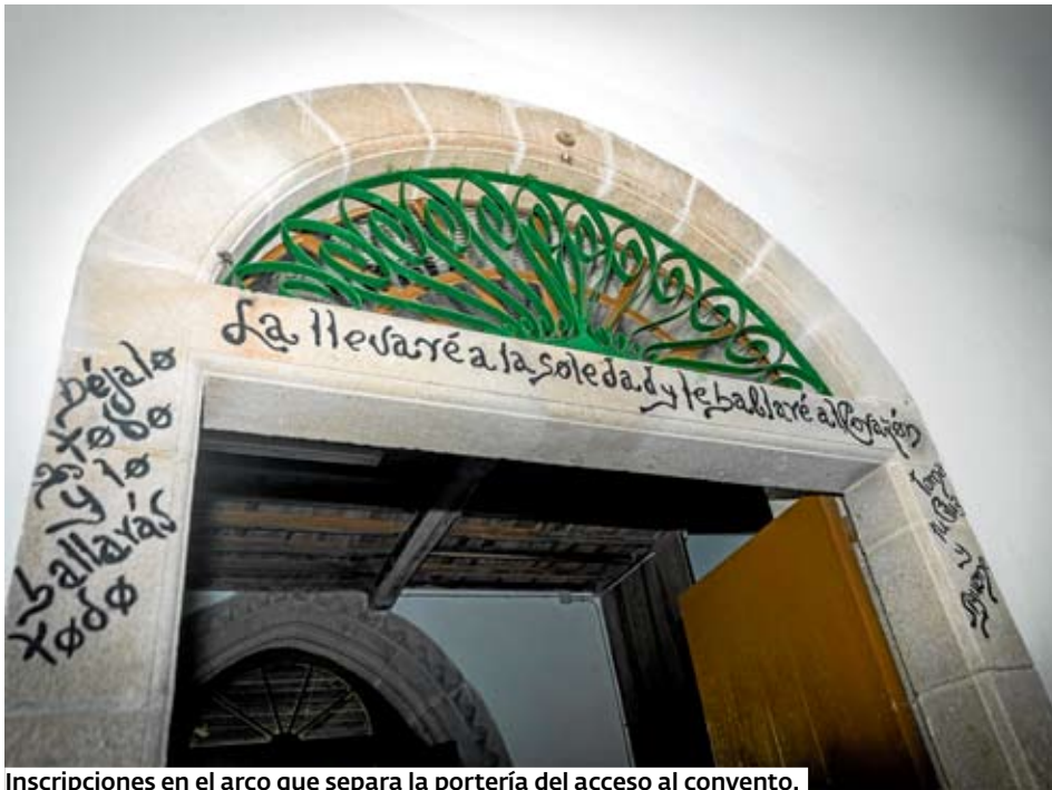
Inscripciones en el arco que separa la portería del acceso al convento.