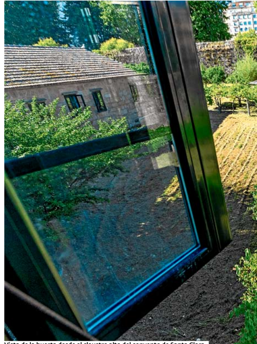
Vista de la huerta desde el claustro alto del convento de Santa Clara.

SIGLO XIII. La visita guiada comienza en la portería del convento, «un dos poucos espazos aos que a cidadanía podía acceder», recuerda el guía, que repasa brevemente la historia del monumento, del que se conserva poca documentación. El inicio de la construcción se remonta a finales del siglo XIII. En el siglo siguiente será cuando se consolide en la ciudad esta orden mendicante (que profesa voto de pobreza), equivalente femenino de los franciscanos. Desde entonces, se han seguido construyendo añadidos a la edificación original, situada en una de las vías de acceso más importantes a la ciudad, el Camiño de Castela. «É o momento de esplendor de Pontevedra como