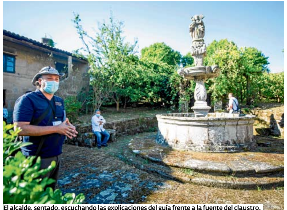
El alcalde, sentado, escuchando las explicaciones del guía frente a la fuente del claustro.