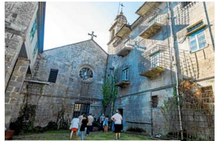
Acceso a la bodega, justo al lado de la Porta de Carros.