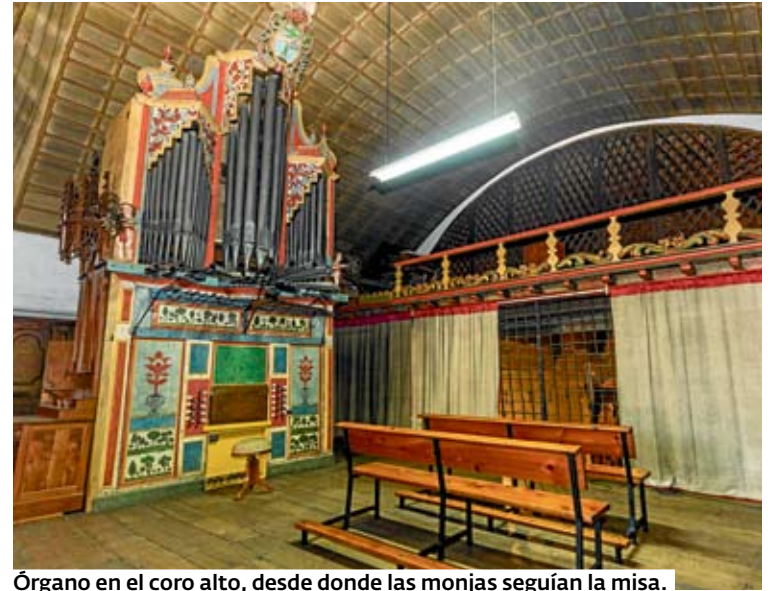
Órgano en el coro alto, desde donde las monjas seguían la misa.