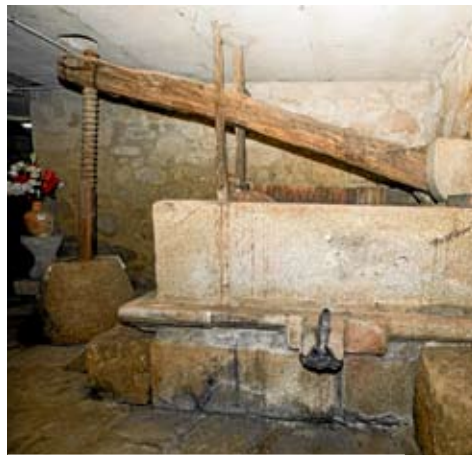
Lagar que se usaba para hacer el vino.