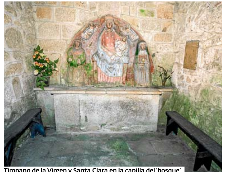
Tímpano de la Virgen y Santa Clara en la capilla del 'bosque'.